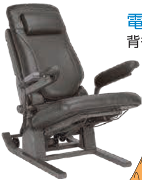
電動チルト機構 背もたれと座板が一緒に傾斜。