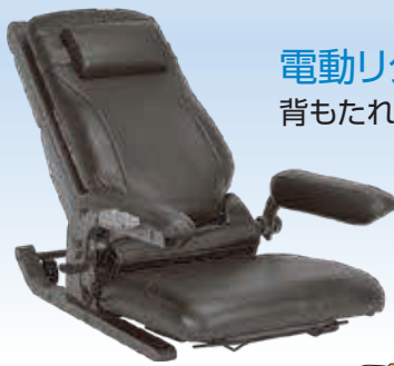
電動リクライニング機構 背もたれがうしろに傾斜。